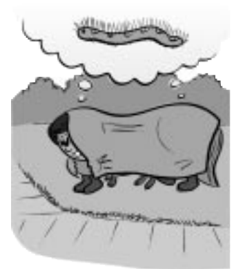
6.0 Les unités thématiques