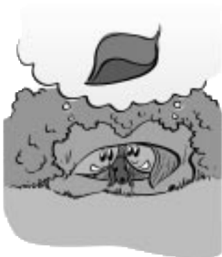
7.0 La bibliographie