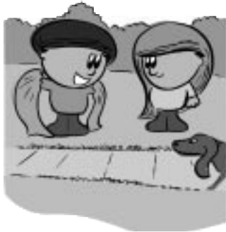
5.0 Les composantes d'un programme d'écriture et de lecture