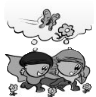
8.0 Les annexes